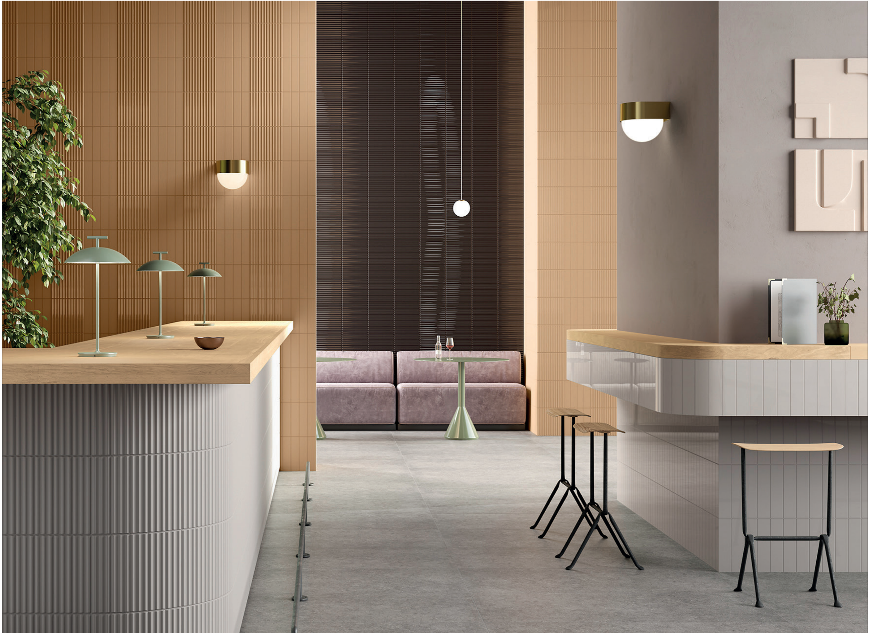
HALL, rivestimento / covering TUBES 1M - TUBES 1FM - TUBES 4M - TUBES 4FL - TUBES 3M (6x25 cm - 2 3 / 8 "x10") pavimento / floor CLAYBORN 3 (60x120 cm - 24"x48")