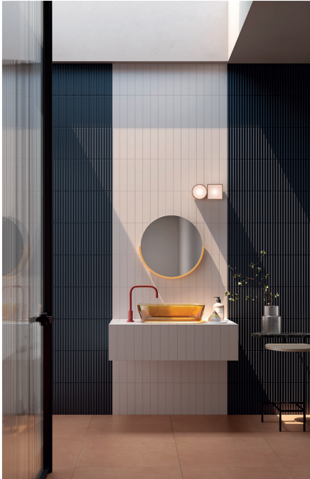
BAGNO / BATHROOM , rivestimento / covering TUBES 4FM - TUBES 6M (6x25 cm - 2 3 / 8 "x10") - pavimento / floor ZIP 3A (60x60 cm - 24"x24") LOUNGE BAR , rivestimento / covering TUBES 4M - TUBES 4FM (6x25 cm - 2 3 / 8 "x10") pavimento / floor CLAYBORN 1 (60x60 cm - 24"x24")