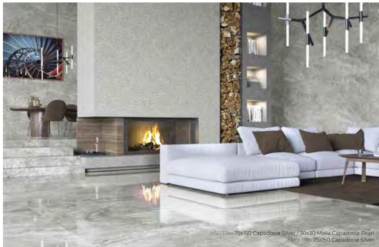
Wall Tiles 75x150 Capadocia Silver / 30x30 Malla Capadocia Pearl Floor tiles 75x150 Capadocia Silver